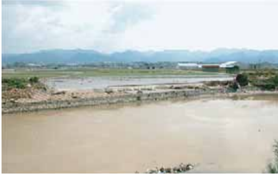
決壊した大日川（志知）