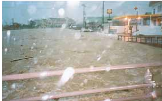
氾濫する三原川（松帆橋から下流）

たび重なる今年の台風、特にこの度の台風二十三号による被害はあまりにも大きく、尊い命を失われた犠牲者の方に哀悼の意を表しますとともに、被災された方々に心よりお見舞い申し上げます。一日も早い被害の復興に力を尽す所存でございます。皆様におかれましてはお身体に気をつけてがんばっていただきたいと存じます。